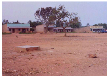
Een stadje in het rode stoffige zand

De rust wordt al snel verstoord door mitrailleurvuur in de onmiddellijke nabijheid van het gebouw. De laatste weken vielen al vaker schoten. De omgeving van het hotel zit vol met gewapende blauwhelmen, dus we voelen ons relatief veilig. Buiten klinkt meer en meer verontrustend lawaai. Het zijn geen kogels meer, maar ontploffingen. Het land is al een tijdje onrustig maar dit zagen we niet aankomen: de burgeroorlog is begonnen.