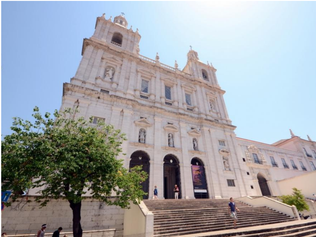
Klooster van São Vicente de Fora

Door haar rooms-katholieke achtergrond kent de stad vele kerken, de ene nog groter dan de andere. De voorzijde van de kerk van Graça biedt een wijde blik over de omgeving, terwijl de kerk van São Roque van binnen ongekende rijkdom toont. Niet ver van het fort vandaan ligt het klooster van São Vicente de Fora. Een bezoek aan het grote klooster staat garant voor weer een adembenemend uitzicht over de stad met de oranje daken en over de Taag. In het kolossale pand zelf rusten de Portugese koningen. Twee van de tombes staan opvallend dicht naast elkaar: die van de koning en de kroonprins die in 1908 werden vermoord. Voor de tombes knielt in marmer de koningin, de huilende weduwe die de aanslag overleefde. Twee jaar later was de monarchie in Portugal ten einde.