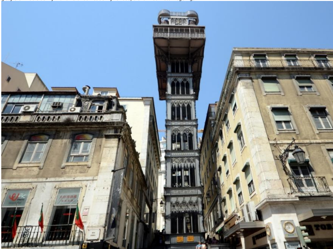
Elevador de Santa Justa

Waar de klimmen te zwaar worden voor de vermoeide benen, zijn verschillende voorzieningen aanwezig. De elevador de Glória is er één van: een vreemde, korte en scheve tram uit de 19e eeuw die je een flinke klim bespaart. Elders vormt de elevador van Santa Justa een oude en degelijke gietijzeren lift die de wijk Baixa verbindt met de wijk Chiado, die ruim 30 meter hoger ligt.